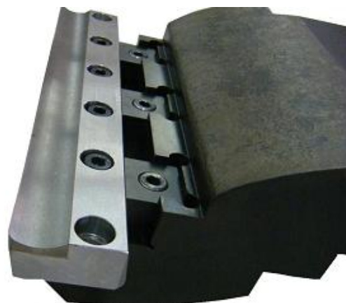
スカイピングツール

マシニングでの溝加工に使用。 ハイスの特性である仕上面の良さを活かし 研磨工程の短縮に貢献。